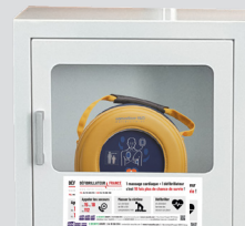
(Selon stock disponible)